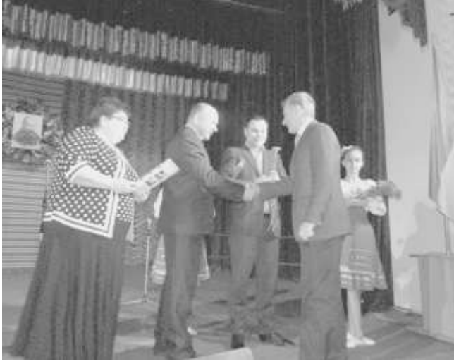
(Закінчення. Поч. на 1 стор.)

Після слів привітання відбулося нагородження грамотами районних державної адміністрації та ради працівників освіти і культури Вінницького району з нагоди відзначення 200-річчя від дня народження Тараса Шев-