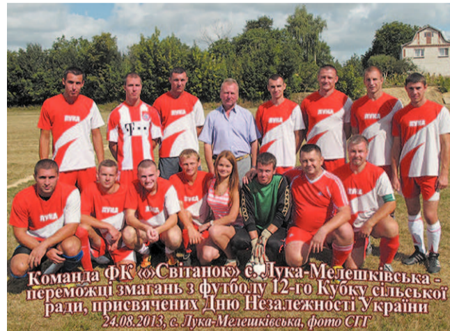
Команда ФК «Світанок» с. Лука-Мелешківська - переможці змагань з футболу 12-го Кубку сільської ради, присвячених Дню Незалежності України 24.08.2013, с. Лука-Мелешківська