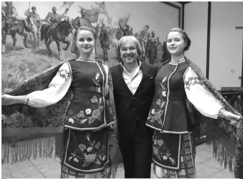
Іванна та Богдана разом із заслуженим артистом України Михайлом Грицканом.