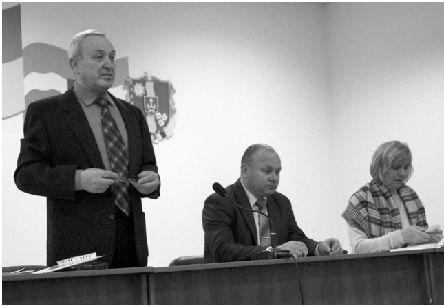
Днями у приміщенні Вінницької райради відбувся Семінар голів первинних ветеранських організацій Вінницького району. Темою для обговорення стали: підбиття підсумків